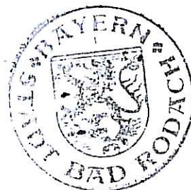
Gerold Strobel 1. Bürgermeister