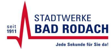
Gesamtstromlieferung des Unternehmens

Stromkennzeichnung gem. § 42 Energiewirtschaftsgesetz vom 7. Juli 2005 geändert 2011